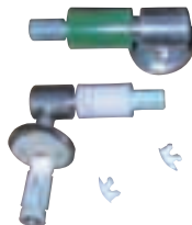
E3117-CP + ETA011-CP